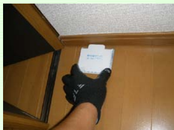
モニタリング調査