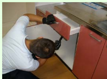
インスペクション(調査)